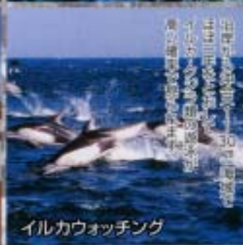
イルカウォッチング

地球の丸く見える丘展望館は、 美しい自然を満喫しながら、 銚子港の歴史を学ぶ ことができます。