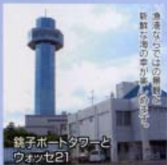
銚子ポートタワーと ウォッセ21