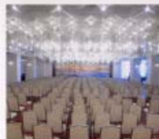
コンベンションホール【潮風】