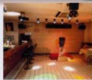
カラオケスナック【モエト】