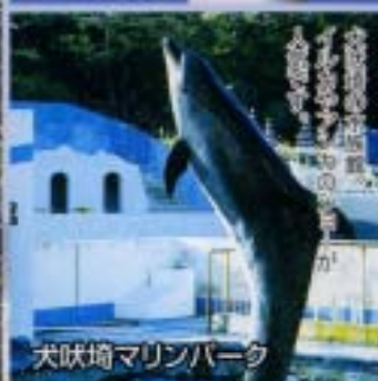
犬吠埼マリンパーク

犬吠埼灯台は、 太平洋に面した 岬の先端にあり、 美しい自然を 満喫しながら、 銚子港の歴史を 学ぶことができます。