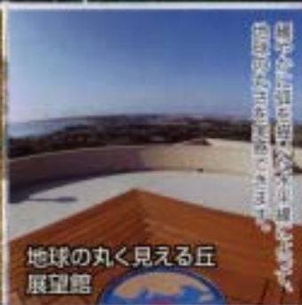
地球の丸く見える丘 展望館

地球の丸く見える丘展望館は、 美しい自然を満喫しながら、 銚子港の歴史を学ぶ ことができます。