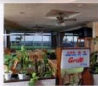
お食事処 喫茶【グリル】【潮風】